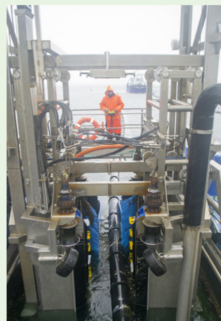
Da GRØNT besøgte Blå Biomasse, er de i gang med at tynde ud i muslingerne. En del bliver sejlet nordpå, imens resten bliver hængende og kan vokse sig større.