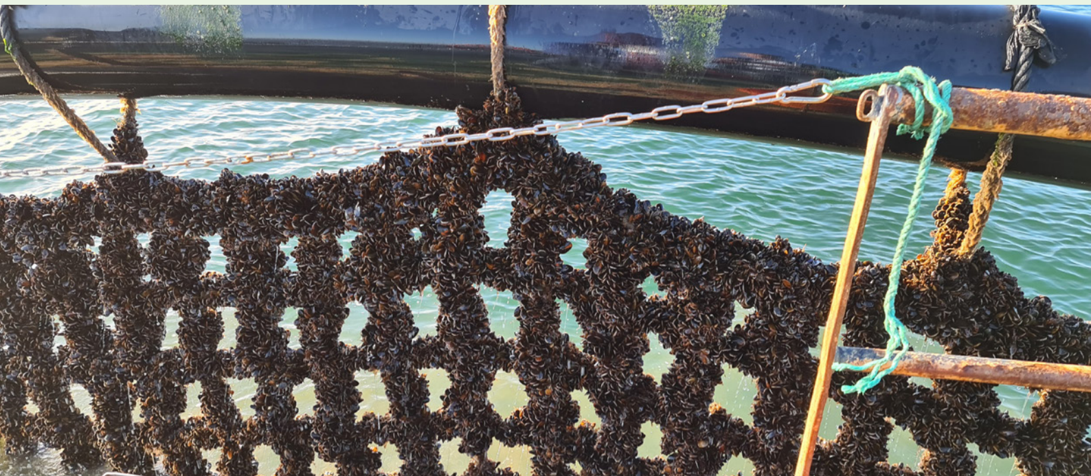
Blå Biomasse høster hvert år 8000 tons muslinger i Limfjorden. Muslingerne fjerner 100 tons kvælstof