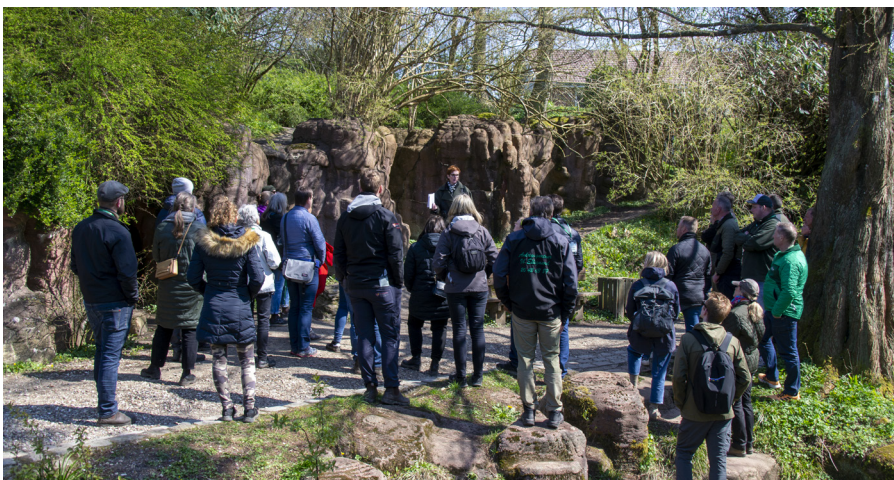
Have & Landskab inviterede til forårstræf i Kolding med fokus på træer.