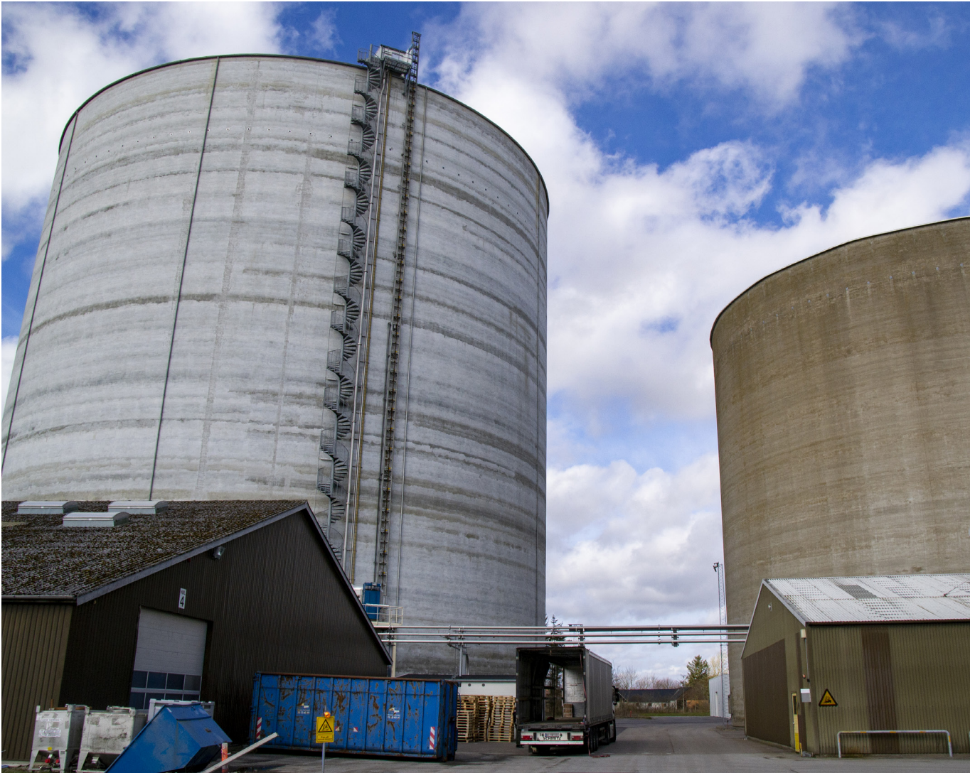
I 2019 stod den seneste silo klar hos AKV Langholt. Den er 60 meter høj og er verdens største stivelsessilo. Den kan rumme 69.000 ton kartoffelstivelse.

i den såkaldte kampagnesæson, som varer fra starten af september og året ud. Her kommer lastbiler forbi i døgndrift for at aflevere kartofler.