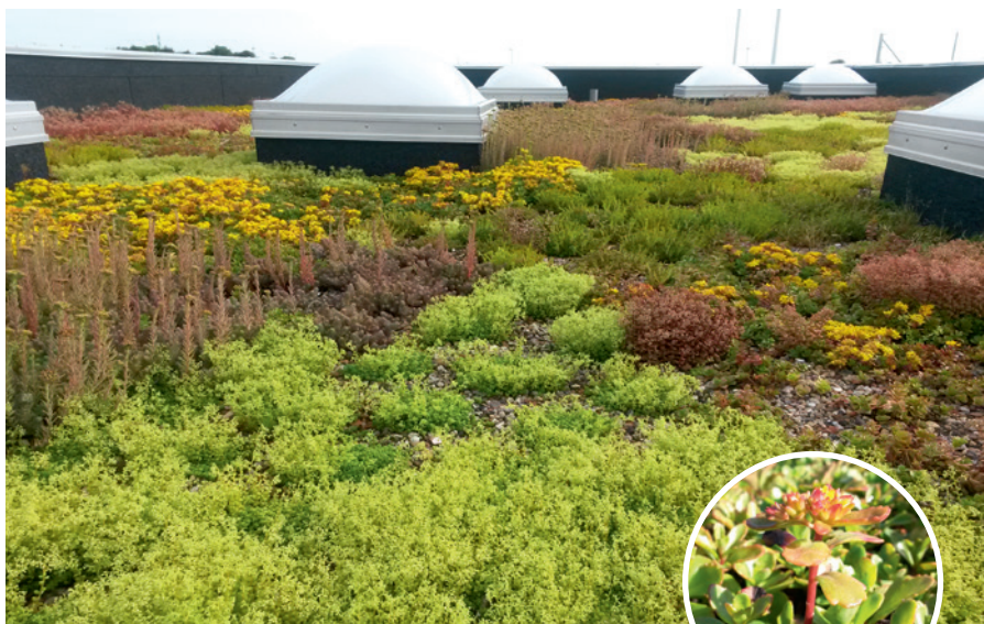
Biodiversitet, temperaturregulering og bæredygtig regnvandshåndtering – på et og samme tag.