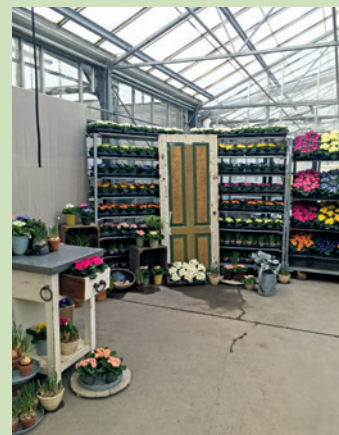
Billedet er fra et bloggerevent afholdt ved Gartneriet Pedersen.