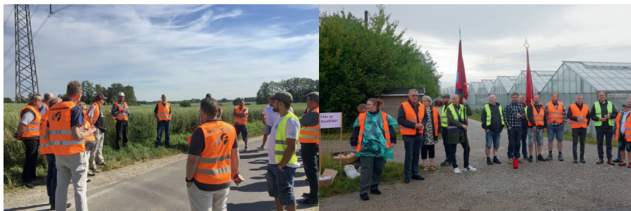
"OK pres mod entreprenører - Det Grønne Område" har etableret en lang række konflikter rundt omkring i landet. Blandt andet i Sengeløse (tv.) og i Malling (th.)

"Vi kan konstatere, at antallet af virksomheder, der bruger billige entreprenør-